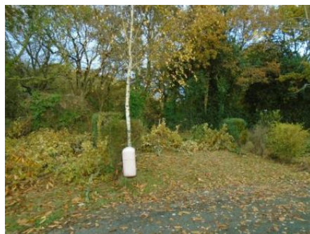
Emplacement du futur bloc sanitaire