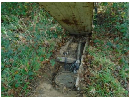
Actuelle poste de relevage en amont de la fosse toutes eaux