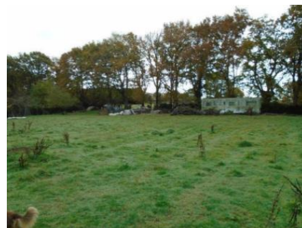
Evacuation des eaux usées par tranchées drainantes